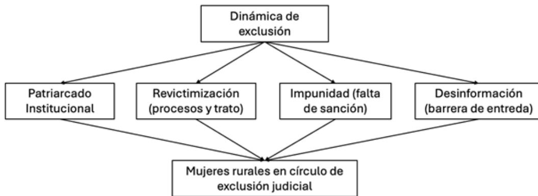
Figura 2. Dinámica de exclusión en el acceso a la justicia para mujeres rurales.

En este sentido, los resultados permiten afirmar que la Fiscalía Regional de Texcoco opera en un entorno institucional que reproduce prácticas discriminatorias, aun cuando existen marcos legales progresistas. El desfase entre norma y práctica no es circunstancial, sino estructural. Tal como lo señala Farmer (2004), la violencia institucional se enmascara como neutralidad burocrática, pero sus efectos son letales en términos de derechos humanos. La falta de sanción, el abandono a las denunciantes y la reproducción de estigmas consolidan un ciclo de exclusión judicial que desactiva la capacidad transformadora del Estado de derecho. Evaluar estas barreras desde un enfoque interseccional no solo evidencia su profundidad, sino también los puntos críticos desde los cuales puede actuarse.